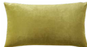
BERLINGOT – Sulfure – 984631 Coussin 33 x 57 cm face en velours uni 13'' x 22'' pillow, face in solid velour