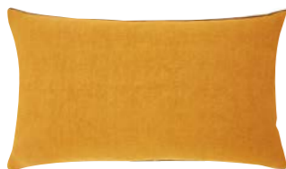
PIGMENT – Jaune d'or – 919301 Coussin 33 x 57 cm, 100% lin uni 13'' x 22'' pillow, 100% solid linen