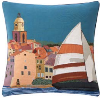
CIGALES – Azur V – 1010314 Coussin 45 x 45 cm en tapisserie - 18" x 18" pillow, tapestry

The sun, the sea and St. Tropez! The legendary village and its bell tower seen from aboard a sailing boat in full sail. Further away on the coast, a moment of bliss in a deserted creek in the shade of lofty pines. Jacquard cotton tapestry woven in Belgium