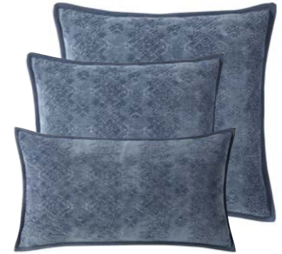
Zinc 1011157 / 979811 / 979806