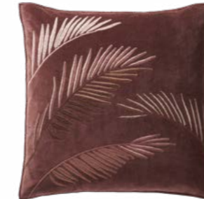
PALMIRA – Grenade 1002720 Velours brodé - Embroidered velour