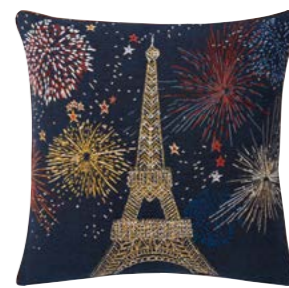
JOIE' – Nuit 983053 Tapisserie - Tapestry