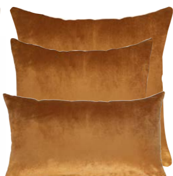
Caramel 881197 / 881196 / 881195