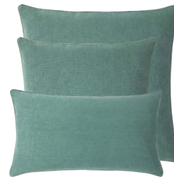
Mousse 978671 / 978670 / 978669