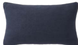
PIGMENT – Nuit – 1005435 NEW Coussin 33 x 57 cm, 100% lin uni 13" x 22" pillow, 100% solid linen