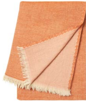
Poudre – 943999