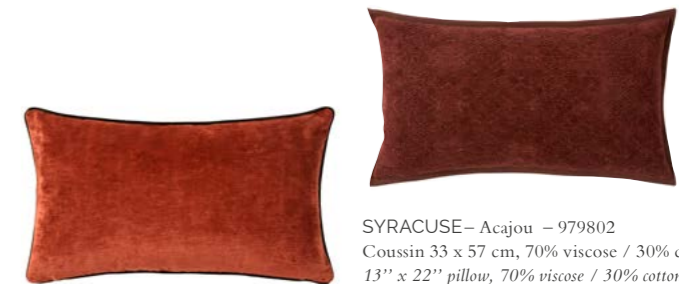
SYRACUSE– Acajou – 979802 Coussin 33 x 57 cm, 70% viscose / 30% coton. 13'' x 22'' pillow, 70% viscose / 30% cotton.