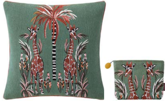
MESDEMOISELLES- Menthe – 1007627 / 1010527 Coussin 45 x 45 cm et trousse 16 x 22 cm en tapiserie 18" x 18" pillow and 6" x 8" tote, tapestry

Nonchalantly, two sister giraffes shelter in the shade of a ruffled palm tree. Their long legs tread through some colourful exotic plants. Jacquard cotton tapestry woven in Belgium