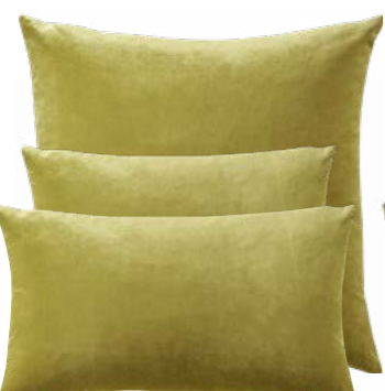
Sulfure 984633 / 984632 / 984631