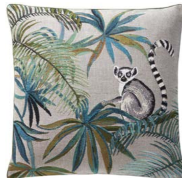
JAPURA– Curaçao L – 1000524 Coussin 45 x 45 cm en tapisserie 18'' x 18'' pillow, tapestry