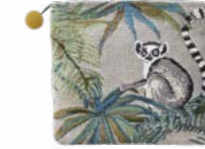
JAPURA - Curaçao 1000114 Tapisserie - Tapestry