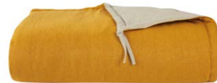
Jaune d'or 983135