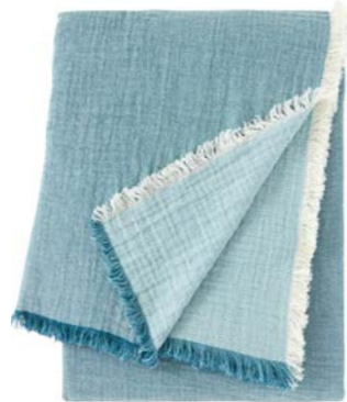
Emeraude - 944107