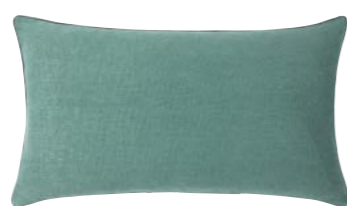
PIGMENT – Mousse – 978669 Coussin 33 x 57 cm, 100% lin uni 13" x 22" pillow, 100% solid linen