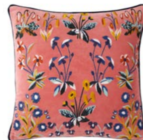
RENAISSANCE - Melba F - 979746 Velours de coton brodé Embroidered cotton velour