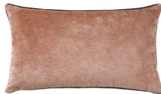
BOROMÉE- Cèdre – 982871 Coussin 33 x 57 cm, 100% velours de lin uni 13" x 22" pillow, 100% solid velour