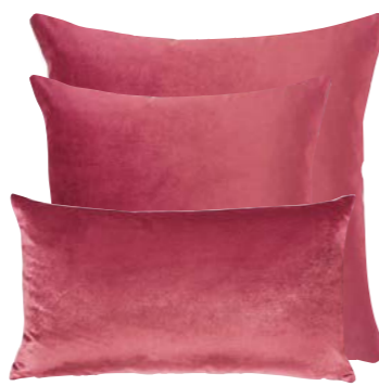
Rose 839235 / 806684 / 453520