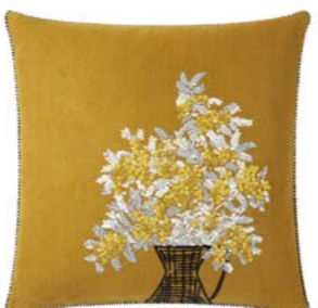
MIMOSA – Ocre 979743 Lin brodé - Embroidered linen