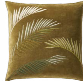
PALMIRA – Bronze 1002722 Velours brodé - Embroidered velour