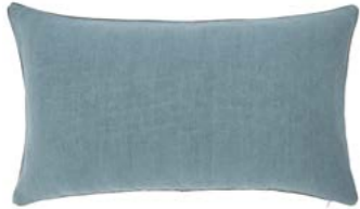
PIGMENT – Denim – 919296 Coussin 33 x 57 cm, 100% lin uni 13" x 22" pillow, 100% solid linen