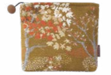
ENCHANTÉE - Gold 1004069