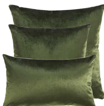
Kaki 20845421 / 844377 / 844376