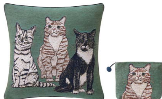
GANGSTERS – Mousse – 1009756 / 1010273 Coussin 45 x 45 cm et trousse 16 x 22 cm en tapiserie 18" x 18" pillow and 6" x 8" tote, tapestry