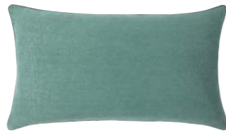
PIGMENT – Mousse – 978669 Coussin 33 x 57 cm, 100% lin uni 13'' x 22'' pillow, 100% solid linen