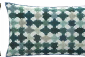
FLORENTINE – Turquoise 1003529 Velours imprimé - Printed velour