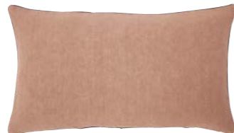
PIGMENT – Pêche – 919305 Coussin 33 x 57 cm, 100% lin uni 13'' x 22'' pillow, 100% solid linen