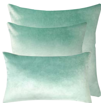
Jade 969297 / 969296 / 969295

Front in solid velour 60% viscose / 31% cotton / 9% polyester, back in 100% natural linen. 22"x22", 18"x18" & 13"x22". Woven in Italy.