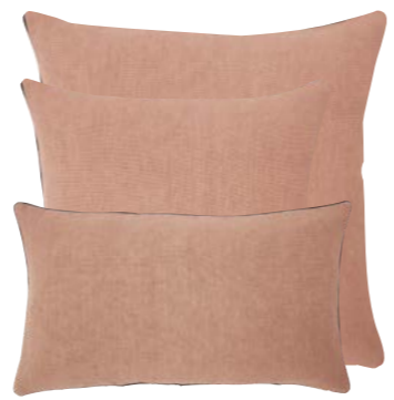
Pêche 939105 / 919306 / 919305