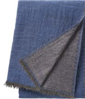
Denim – 950416