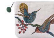
RAGAZZI – Blanc – 1010529 / 1011132 Coussin 45 x 45 cm et trousse 16 x 22 cm en tapisserie 18" x 18" pillow and 6" x 8" tote, tapestry