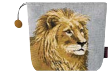
LÉONIS - Nuage 983047 Tapisserie - Tapestry