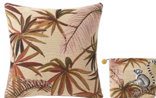
JAPURA– Ambre – 1000521 / 1000113 Coussin 45 x 45 cm et trousse 16 x 22 cm en tapisserie 18'' x 18'' pillow and 6''x18'' tote, tapestry