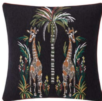
MESDEMOISELLES – Ebène – 1007626 Coussin 45 x 45 cm en tapiserie 18" x 18" pillow, tapestry