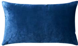
BERLINGOT – Porcelaine – 960684 Coussin 33 x 57 cm, face en velours uni 13'' x 22'' pillow, face in solid velour