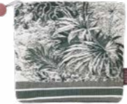
POUR TOUJOURS Paon - 1004525 Tapisserie - Tapestry