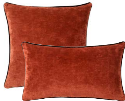
BOROMÉE – Ambre – 982878 / 982873