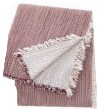
Bois Rouge NEW - 1010612