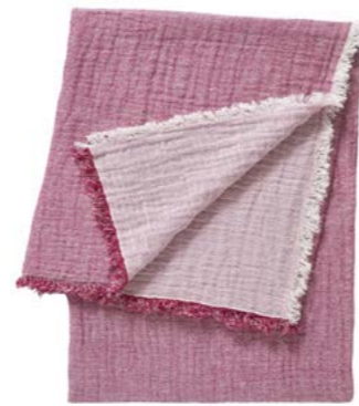
Hibiscus - 965277