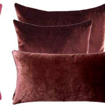
Grenade 1000112 / 1000111 / 1000110