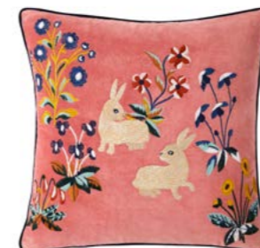
RENAISSANCE - Melba L - 979747 Velours de coton brodé Embroidered cotton velour