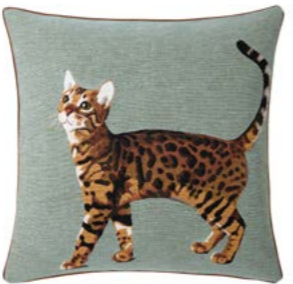
BENGAL – Mousse 979024 Tapisserie - Tapestry