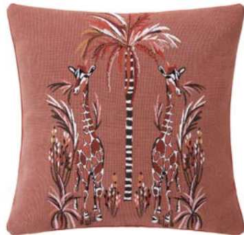
MESDEMOISELLES- Cèdre – 1007625 Coussin 45 x 45 cm en tapiserie 18" x 18" pillow, tapestry