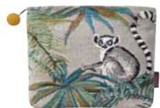
JAPURA– Curaçao – 1000114 Trousse 16 x 22 cm en tapisserie 6'' x 8'' tote, tapestry