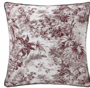
POUR TOUJOURS – Grenade 1004522 Tapisserie - Tapestry