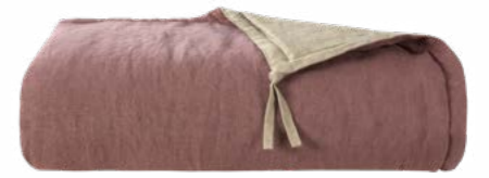
Amarante NEW 983128