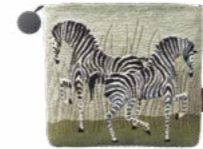
FIFTY FIFTY - Céladon 1003463 Tapisserie - Tapestry