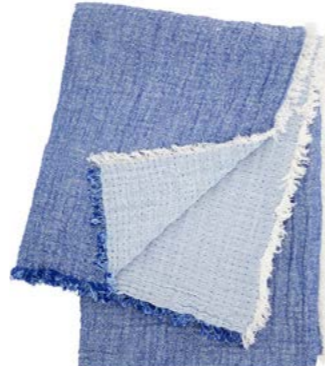
Denim - 914908