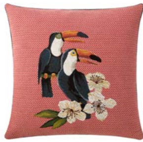
TUK – Goyave 983048 Tapisserie - Tapestry