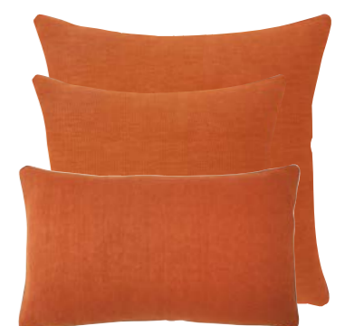
Cuir 939099 / 919294 / 919293