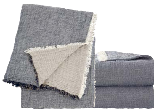
Ardoise - 914907 / 962843