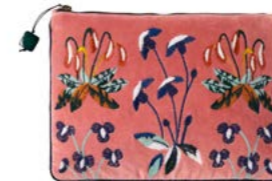
RENAISSANCE - Melba 979749 Velours de coton brodé Embroidered cotton velour