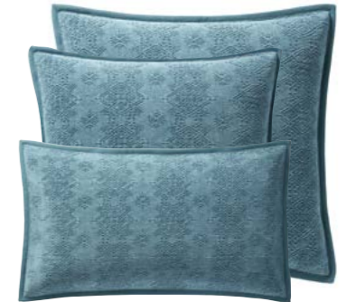
Turquoise 1011156 / 1000116 / 1000115