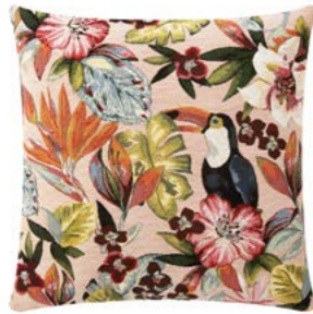
UTOPIA – Goyave 983044 Tapisserie - Tapestry