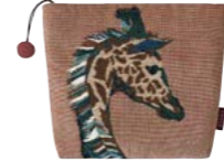
HARRIET - Cèdre 974693 Tapisserie - Tapestry