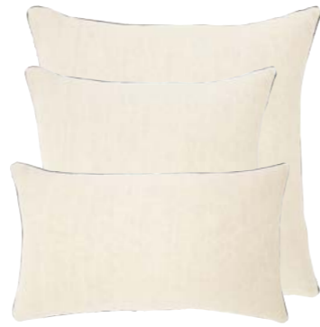
Vapeur 939106 / 919308 / 919307

Pillow, front and back in solid color, 100% linen, piped finish. 22"x22", 18"x18" & 13"x22".