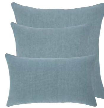
Denim 939100 / 919295 / 919296