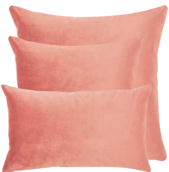
Rose Cèdre 953690 / 953689 / 953640