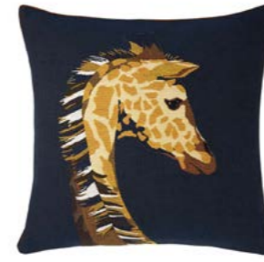
HARRIET – Nuit 971308 Tapisserie - Tapestry