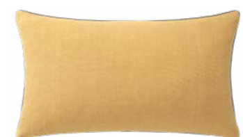
PIGMENT – Rotin – 1008602 NEW Coussin 33 x 57 cm, 100% lin uni 13" x 22" pillow, 100% solid linen