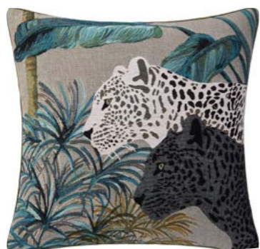
JAPURA– Curaçao P – 1005426 NEW Coussin 45 x 45 cm en tapisserie 18'' x 18'' pillow, tapestry