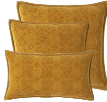
Safran 1011155 / 979810 / 979805

Front and back in stone washed Jacquard, 70% viscose and 30% cotton, 22" x 22", 18"x18" and 13"x22".