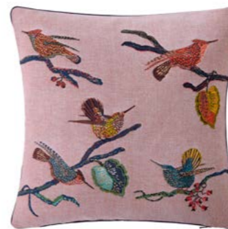
RAGAZZI – Rose – 1011131 Coussin 45 x 45 cm en tapisserie 18" x 18" pillow, tapestry