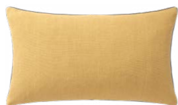
PIGMENT – Rotin – 1008602 NEW Coussin 33 x 57 cm, 100% lin uni 13" x 22" pillow, 100% solid linen