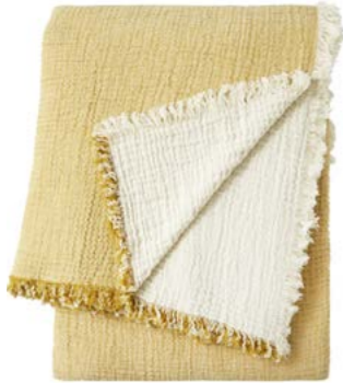
Citron - 944106