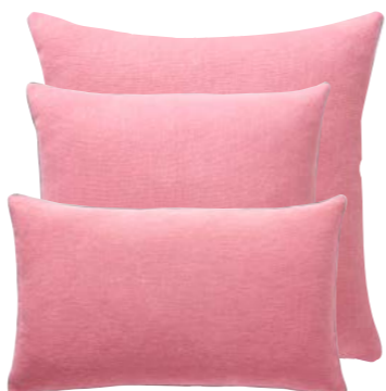
Goyave 978396 / 978395 / 978394