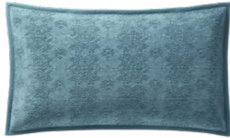
SYRACUSE – Turquoise – 1000115 Coussin 33 x 57 cm, 70% viscose / 30% coton. 13" x 22" pillow, 70% viscose / 30% cotton.