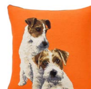
MILOUS – Orange 966146 Tapisserie - Tapestry