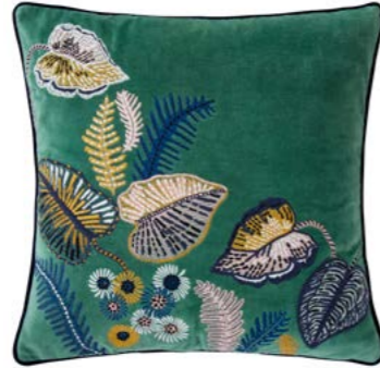
BOBOLI – Mousse – 1010673 Coussin 45 x 45 cm en velours brodé 18'' x 18'' pillow, embroidered velour

Leaves, ferns and flowers intertwine, the stylised design is rich in embroidery and shades of thread. The cotton velvet used makes the harmony of shades sing. Embroidery on cotton velvet, thick velvet piping finish