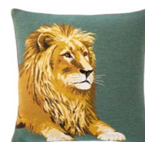
LÉONIS – Savane 979876 Tapisserie - Tapestry