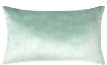
BERLINGOT – Jade – 969295 Coussin 33 x 57 cm, face en velours uni 13" x 22" pillow, face in solid velour