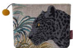
JAPURA– Curaçao P – 1010611 NEW Trousse 16 x 22 cm en tapisserie 6'' x 18'' tote, tapestry