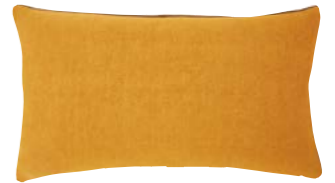
PIGMENT – Jaune d'or – 919301 Coussin 33 x 57 cm, 100% lin uni 13" x 22" pillow, 100% solid linen