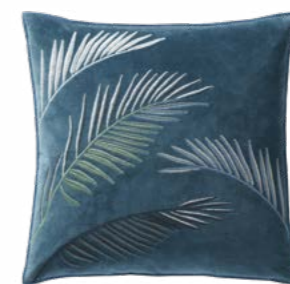
PALMIRA – Orage 1002721 Velours brodé - Embroidered velour