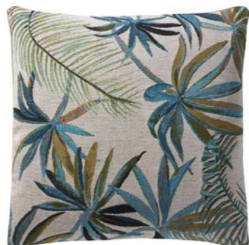
JAPURA– Curaçao – 1000523 Coussin 45 x 45 cm en tapisserie 18'' x 18'' pillow, tapestry