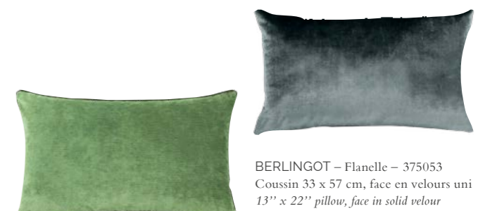
BOROMÉE – Menthe – 982869 Coussin 33 x 57 cm, 100% velours de lin uni 13'' x 22'' pillow, 100% solid velour