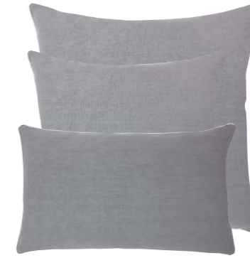
Zinc 939107 / 929410 / 929409