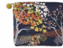
ENCHANTÉE - Nuit 1004071 Tapisserie - Tapestry