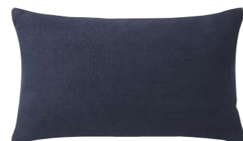
PIGMENT – Nuit – 1005435 Coussin 33 x 57 cm, 100% lin uni 13" x 22" pillow, 100% solid linen