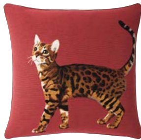
BENGAL – Corail 982385 Tapisserie - Tapestry