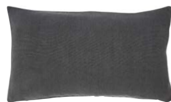
PIGMENT – Ardoise – 919288 Coussin 33 x 57 cm, 100% lin uni 13" x 22" pillow, 100% solid linen