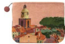
CIGALES – Pêche – 1011426 Trousse 16 x 22 cm en tapisserie 6" x 8" tote, tapestry