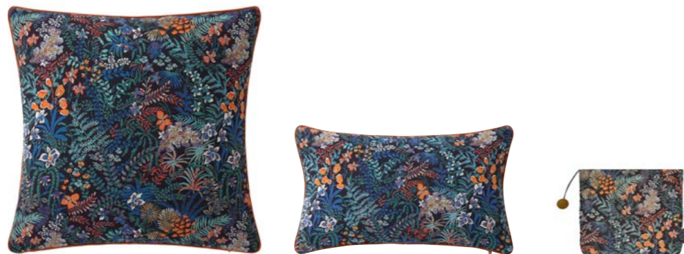
ONIRIC – Nuit – 1011465 / 1011466 / 1011428 Coussins 56 x 56 cm et 33 x 57 cm et trousse 16 x 22 cm, tapisserie 22" x 22" and 13" x 22" pillow and 7" x 8" tote, tapestry

A tropical garden illustrated, as in a curiosity cabinet, in multi-coloured strokes on a navy background. A fashion and deco inspiration in tune with the times. Jacquard cotton tapestry woven in Belgium.