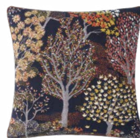
ENCHANTÉE – Nuit 1003994 Tapisserie - Tapestry