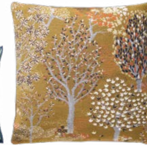
ENCHANTÉE – Gold 1003993 Tapisserie - Tapestry