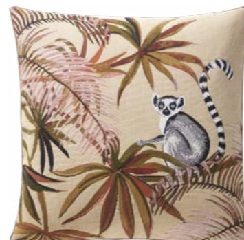
JAPURA– Ambre L – 1000522 Coussin 45 x 45 cm en tapisserie 18'' x 18'' pillow, tapestry