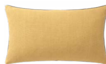
PIGMENT – Rotin – 1008602 NEW Coussin 33 x 57 cm, 100% lin uni 13" x 22" pillow, 100% solid linen