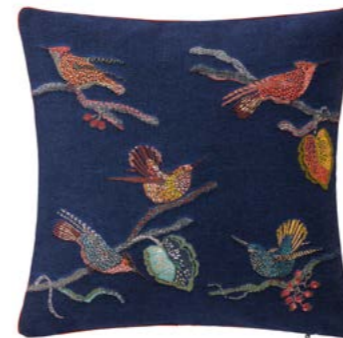
RAGAZZI – Nuit – 1011130 Coussin 45 x 45 cm en tapisserie 18" x 18" pillow, tapestry