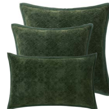
Kaki NEW 1011153 / 1005439 / 1005438