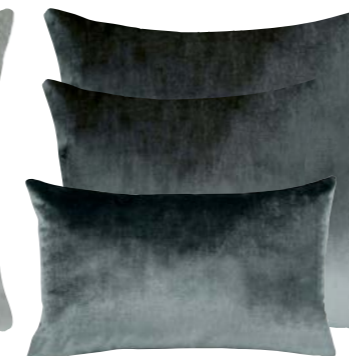
Flanelle 840156 / 375043 / 375053