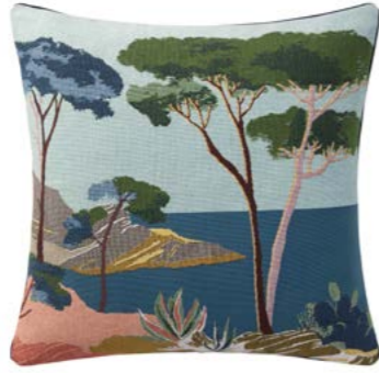
CIGALES – Azur P – 1010313 Coussin 45 x 45 cm en tapisserie 18" x 18" pillow, tapestry