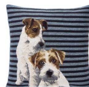
MILOUS – Marinière 966141 Tapisserie - Tapestry