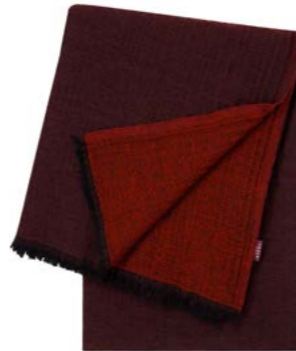
Amarante – 969385