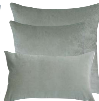
Gris 839240 / 375042 / 375052