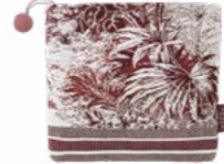
POUR TOUJOURS Grenade - 1004523 Tapisserie - Tapestry