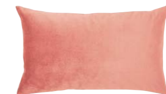
BERLINGOT – Rose Cèdre – 953640 Coussin 33 x 57 cm, face en velours uni 13" x 22" pillow, face in solid velour