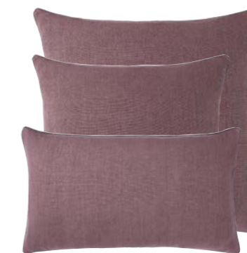
Amarante 1000002 / 969291 / 969290