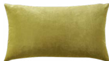
BERLINGOT – Sulfure – 984631 Coussin 33 x 57 cm, face en velours uni 13" x 22" pillow, face in solid velour