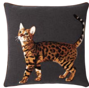
BENGAL – Carbon 982383 Tapisserie - Tapestry