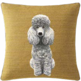
DRAGUEUR – Ocre 1002724 Tapisserie - Tapestry