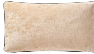
BOROMÉE – Grège – 1000080 Coussin 33 x 57 cm, 100% velours de lin uni 13'' x 22'' pillow, 100% solid velour