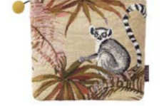
JAPURA - Ambre 1000113 Tapisserie - Tapestry