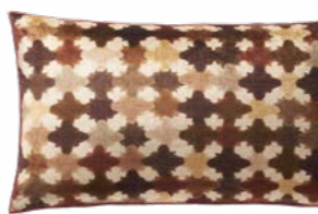
FLORENTINE – Grenade 1003527 Velours imprimé - Printed velour