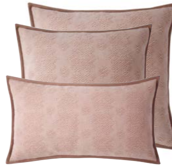
Pétale 1011154 / 979809 / 979804