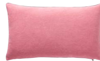
PIGMENT – Goyave – 978394 Coussin 33 x 57 cm, 100% lin uni 13" x 22" pillow, 100% solid linen