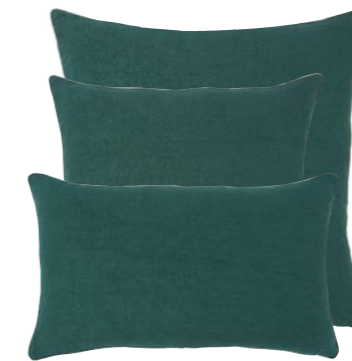
Laurier 940394 / 940393 / 940392