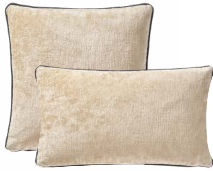
BOROMÉE – Grège – 1000081 / 1000080

An irregular and matte texture characterises this generous linen velvet, in bright shades ; cushions highlighted with a dark velvet piping. Woven in Belgium. 18" x 18" and 13" x 22" pillow, front and back in 100% solid linen velvet