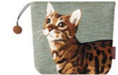
BENGAL - Mousse 982386 Tapisserie - Tapestry