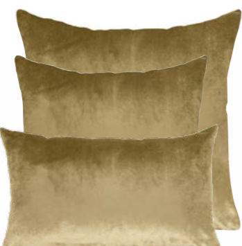
Daim 840154 / 832970 / 833042