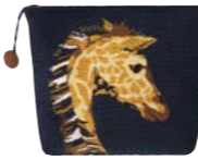
HARRIET - Nuit 972920 Tapisserie - Tapestry