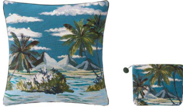
ÎLE COCOS – Ciel – 1009764 / 1010319 Coussin 45 x 45 cm et trousse 16 x 22 cm en tapisserie 18" x 18" pillow and 6" x 8" tote, tapestry

VIRGIN ISLANDS, Ukulele, Hawaiian shirts, fruity cocktails and raffia fringes, these two postcard cushions take us off into a quirky decorative imagination. Jacquard cotton tapestry woven in Belgium.