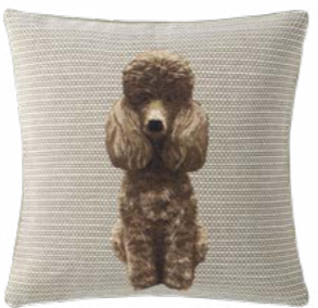
DRAGUEUR – Ice 1004068 Tapisserie - Tapestry