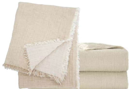
Vapeur - 914909 / 949285