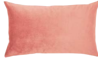
BERLINGOT – Rose Cèdre – 953640 Coussin 33 x 57 cm, face en velours uni 13" x 22" pillow, face in solid velour