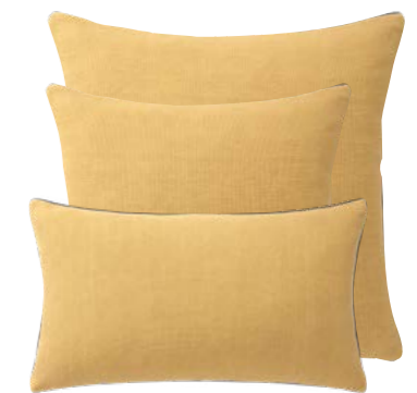
Rotin NEW 1008604 / 1008603 / 1008602