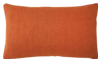
PIGMENT – Cuir – 919293 Coussin 33 x 57 cm, 100% lin uni 13" x 22" pillow, 100% solid linen