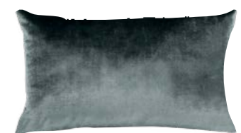
BERLINGOT – Flanelle – 375053 Coussin 33 x 57 cm, face in velours uni 13'' x 22'' pillow, face in solid velour