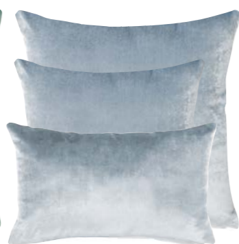
Argent 839243 / 832969 / 832965