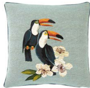
TUK – Jade 983050 Tapisserie - Tapestry