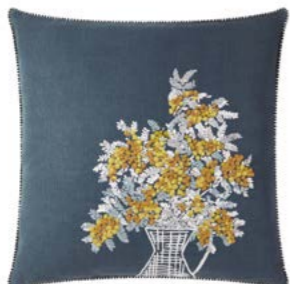
MIMOSA – Egée 979742 100% lin brodé - 100% embroidered linen