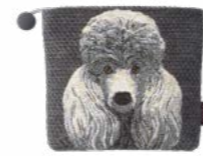
DRAGUEUR - Flanelle 1002851 Tapisserie - Tapestry

TROUSSES 16x22cm & 21x29cm / TOTES 7"x8" & 8"x11"