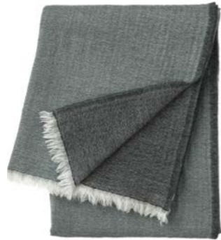
Mousse – 978597

Soft aerial double-weave plaids for a warm caress on cool evenings Throw 100% wool, 51"x 67"