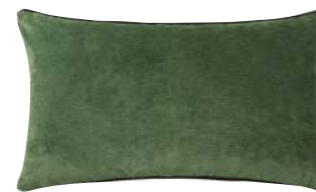
BOROMÉE – Menthe – 982869 Coussin 33 x 57 cm, 100% velours de lin uni 13" x 22" pillow, 100% solid velour