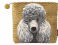
DRAGUEUR - Ocre 1002725 Tapisserie - Tapestry