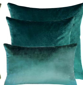
Paon 876968 / 876967 / 876966