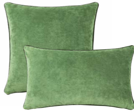
BOROMÉE – Menthe – 982874 / 982869