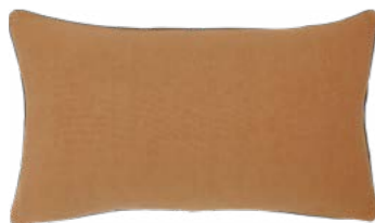
PIGMENT – Caramel – 919290 Coussin 33 x 57 cm, 100% lin uni 13" x 22" pillow, 100% solid linen