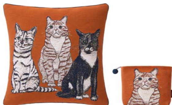
GANGSTERS – Orange – 1009757 / 1011061 Coussin 45 x 45 cm et trousse 18 x 22 cm en tapiserie 18" x 18" pillow and 7" x 8" tote, tapestry

This trio is staring at us and their message is clear, this is our house! The original sketch, drawn in pastel, has been faithfully transcribed in the weave. Jacquard cotton tapestry woven in Belgium