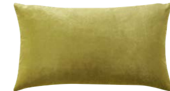
BERLINGOT – Sulfure – 984631 Coussin 33 x 57 cm, face en velours uni 13" x 22" pillow, face in solid velour