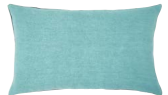
PIGMENT – Denim – 919296 Coussin 33 x 57 cm, 100% lin uni 13" x 22" pillow, 100% solid linen