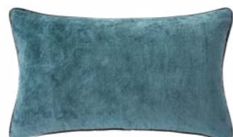
BOROMÉE – Paon – 1010124 NEW Coussin 33 x 57 cm, 100% velours de lin uni 13" x 22" pillow, 100% solid velour