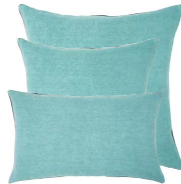
Nil 940391 / 940390 / 940242