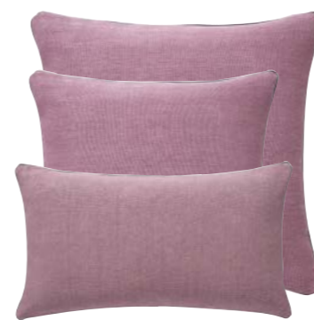
Blush 960928 / 960927 / 960926