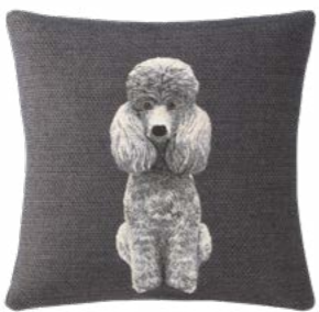
DRAGUEUR – Flanelle 1002723 Tapisserie - Tapestry