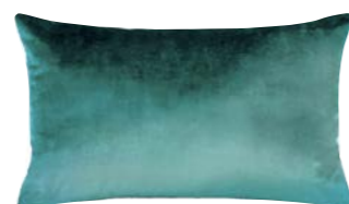
BERLINGOT – Paon – 876966 Coussin 33 x 57 cm face en velours uni 13'' x 22'' pillow, face in solid velour