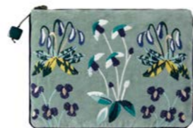
RENAISSANCE - Jade 979748 Velours de coton brodé Embroidered cotton velour