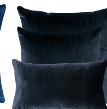
Bleu Nuit 840158 / 374755 / 374760