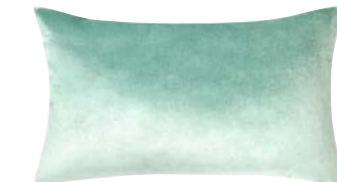
BERLINGOT – Jade – 969295 Coussin 33 x 57 cm, face en velours uni 13" x 22" pillow, face in solid velour