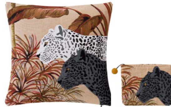
JAPURA– Ambre P – 1005425 / 1010610 NEW Coussin 45 x 45 cm et trousse 16 x 22 cm en tapisserie 18'' x 18'' pillow and 6''x18'' tote, tapestry

Jacquard cotton tapestry woven in Belgium