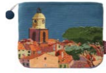
CIGALES – Azur – 1011427 Trousse 16 x 22 cm en tapisserie 6" x 8" tote, tapestry