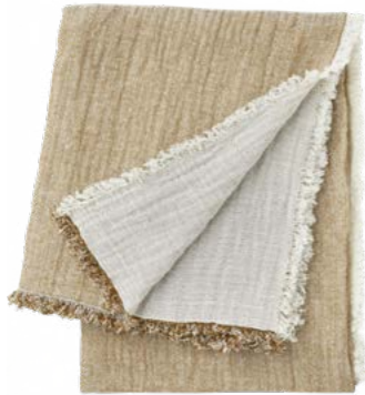
Ambre - 978598

Throw 55"x 79" and bedspread 102"x 94", 70% cotton / 30% linen.