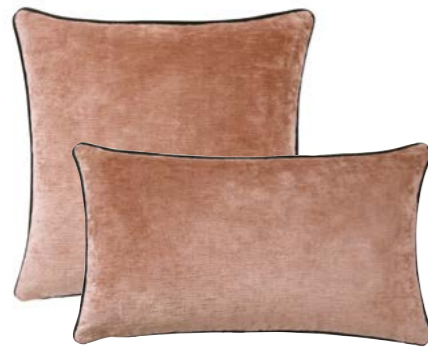
BOROMÉE – Cèdre – 982876 / 982871