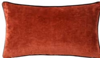
BOROMÉE – Ambre – 982873 Coussin 33 x 57 cm, 100% velours de lin uni 13'' x 22'' pillow, 100% solid velour