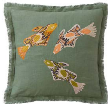
VAO-VAO – Kaki – 1010669 Coussin 45 x 45 cm en lin brodé 18" x 18" pillow, embroidered linen

BY CANOE, The colourful waters of a lagoon highlight three beautiful fish dancing on the water's surface, embroidered with ethnic patterns. Embroidery on heavy linen, fringed finish