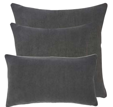
Ardoise 939097 / 919289 / 919288