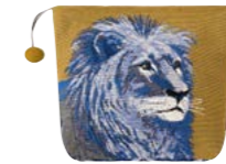
LÉONIS - Ambre 982946 Tapisserie - Tapestry