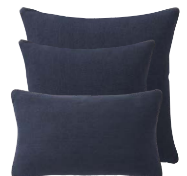
Nuit NEW 1005437 / 1005436 / 1005435