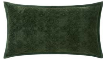
SYRACUSE – Kaki – 1005438 NEW Coussin 33 x 57 cm, 70% viscose / 30% coton. 13" x 22" pillow, 70% viscose / 30% cotton.