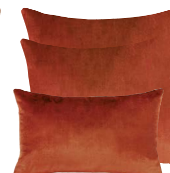
Ambre 868867 / 868866 / 868865