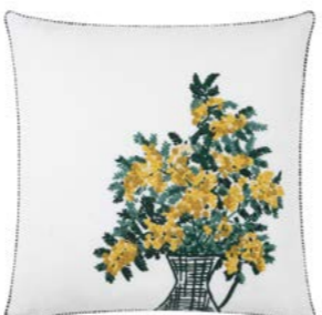
MIMOSA – Blanc 979741 100% lin brodé - 100% embroidered linen