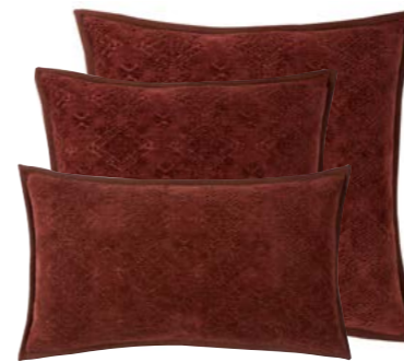
Acajou 1011151 / 979807 / 979802