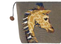
HARRIET - Havane 972919 Tapisserie - Tapestry