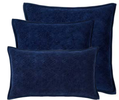
Indigo 1011152 / 979808 / 979803