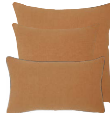
Caramel 939098 / 919292 / 919290