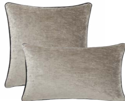
BOROMÉE – Argent – 982877 / 982872