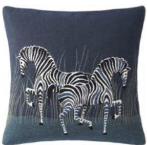
FIFTY FIFTY – Nuit 1000108 Tapisserie - Tapestry