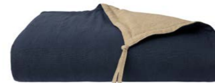
Nuit NEW 1010627