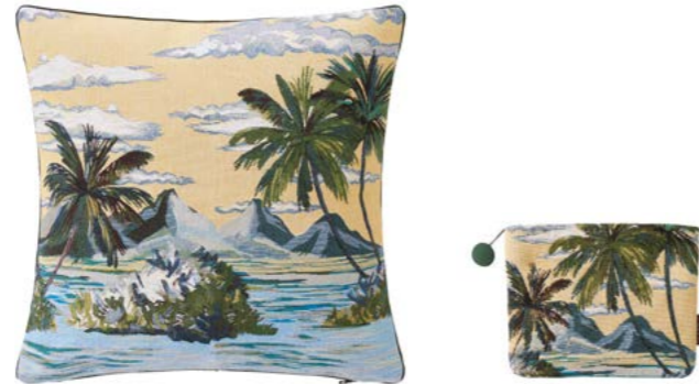
ÎLE COCOS – Soleil – 1009765 / 1010321 Coussin 45 x 45 cm et trousse 16 x 22 cm en tapisserie 18" x 18" pillow and 6" x 8" tote, tapestry