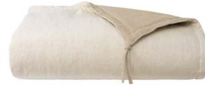
Vapeur NEW 983141

Counterpane, front in solid color and back in solid naturel linen color, front 100% solid linen, back 100% natural linen, 100% polyester filling. Knot finish at the corners. 53" x 71".