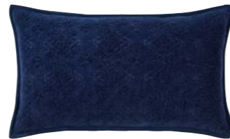
SYRACUSE – Indigo – 979803 Coussin 33 x 57 cm, 70% viscose / 30% coton. 13" x 22" pillow, 70% viscose / 30% cotton.