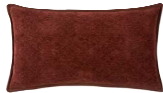
SYRACUSE- Acajou – 979802 Coussin 33 x 57 cm, 70% viscose / 30% coton. 13" x 22" pillow, 70% viscose / 30% cotton.