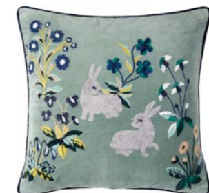
RENAISSANCE - Jade L - 979745 Velours de coton brodé Embroidered cotton velour