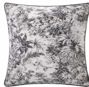
POUR TOUJOURS – Anthracite 1004520 Tapisserie - Tapestry