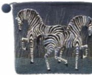
FIFTY FIFTY - Nuit 1002708 Tapisserie - Tapestry