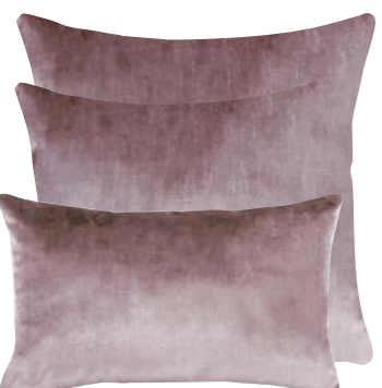
Parme 839242 / 375045 / 375056