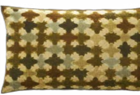
FLORENTINE – Sulfure 1003528 Velours imprimé - Printed velour