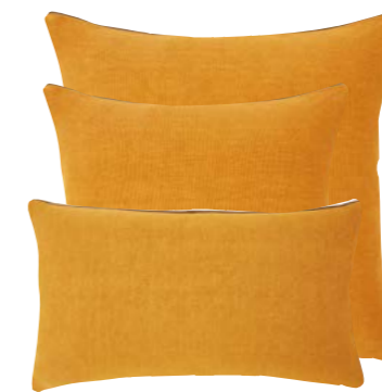
Jaune d'or 939103 / 919302 / 919301