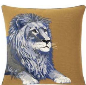
LÉONIS – Ambre 982945 Tapisserie - Tapestry