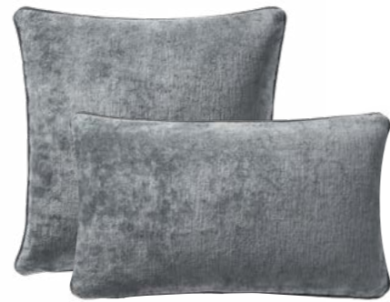
BOROMÉE – Zinc – 1000083 / 1000082