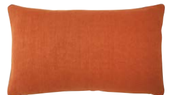
PIGMENT – Cuir – 919293 Coussin 33 x 57 cm, 100% lin uni 13" x 22" pillow, 100% solid linen