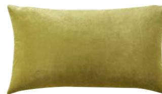
BERLINGOT – Sulfure – 984631 Coussin 33 x 57 cm, face en velours uni 13" x 22" pillow, face in solid velour