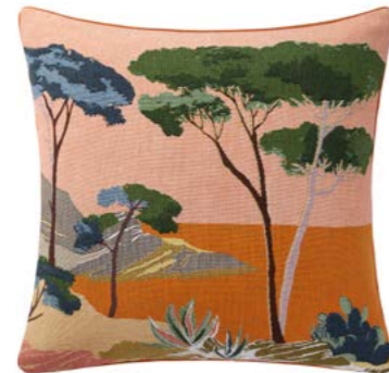
CIGALES – Pêche P – 1011425 Coussin 45 x 45 cm en tapisserie 18" x 18" pillow, tapestry