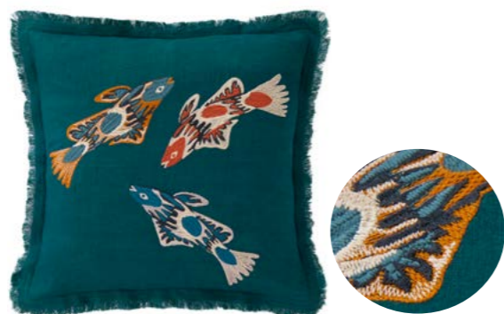
VAO-VAO – Océan – 1010671 Coussin 45 x 45 cm en lin brodé 18" x 18" pillow, embroidered linen