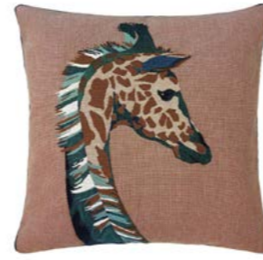
HARRIET – Cèdre 969342 Tapisserie - Tapestry