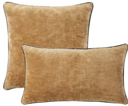
BOROMÉE – Daim – 1000080 / 1000081