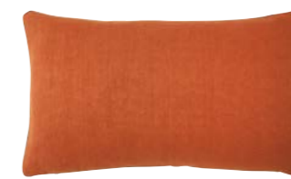
PIGMENT – Cuir – 919293 Coussin 33 x 57 cm, 100% lin uni 13" x 22" pillow, 100% solid linen