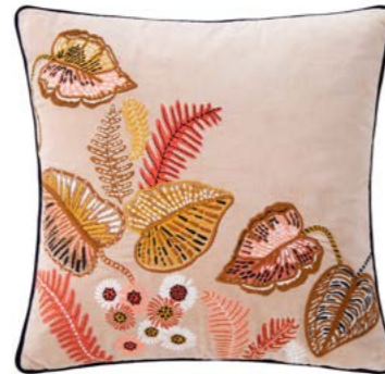
BOBOLI – Aurore – 1010672 Coussin 45 x 45 cm en velours brodé 18'' x 18'' pillow, embroidered velour