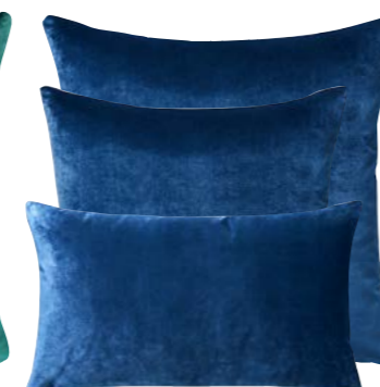
Porcelaine 960686 / 960685 / 960684