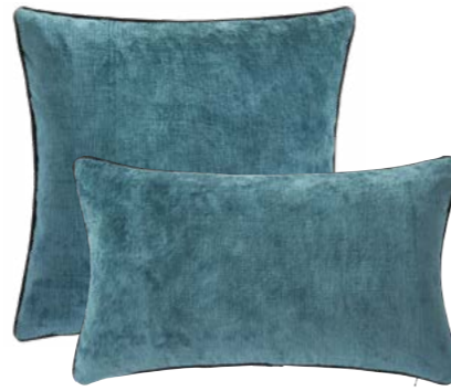
BOROMÉE – Paon – 1010125 / 1010124 NEW