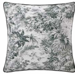
POUR TOUJOURS – Paon 1004524 Tapisserie - Tapestry