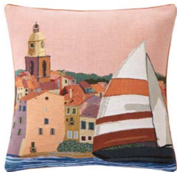
CIGALES – Pêche V – 1010315 Coussin 45 x 45 cm en tapisserie - 18" x 18" pillow, tapestry