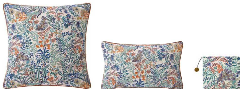
ONIRIC – Perle – 1011467 / 1011468 / 1011429 Coussin 56 x 56 cm, trousse 18 x 22 cm et bas de porte en tapisserie 22" x 22" pillow, 7" x 8" tote and draft excluder, tapestry