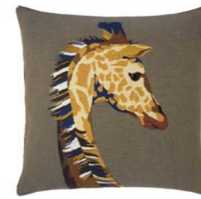
HARRIET – Havane 969343 Tapisserie - Tapestry