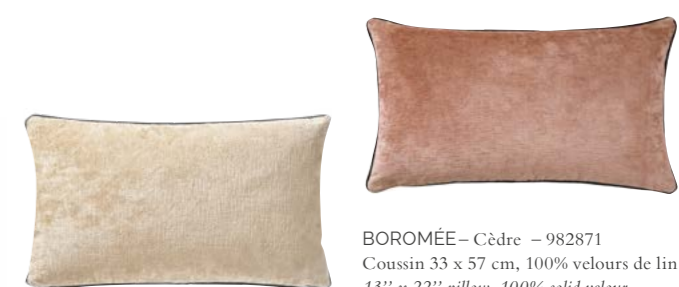
BOROMÉE– Cèdre – 982871 Coussin 33 x 57 cm, 100% velours de lin uni 13'' x 22'' pillow, 100% solid velour