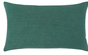
PIGMENT – Laurier – 940392 Coussin 33 x 57 cm, 100% lin uni 13" x 22" pillow, 100% solid linen