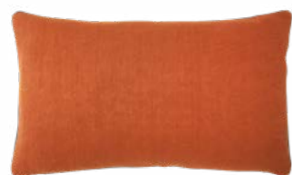
PIGMENT – Cuir – 919293 Coussin 33 x 57 cm, 100% lin uni 13" x 22" pillow, 100% solid linen